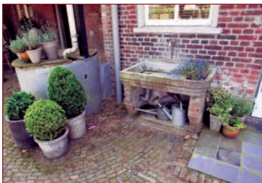
• Potten met buxus. De put onderstreept de boerderijsfeer.