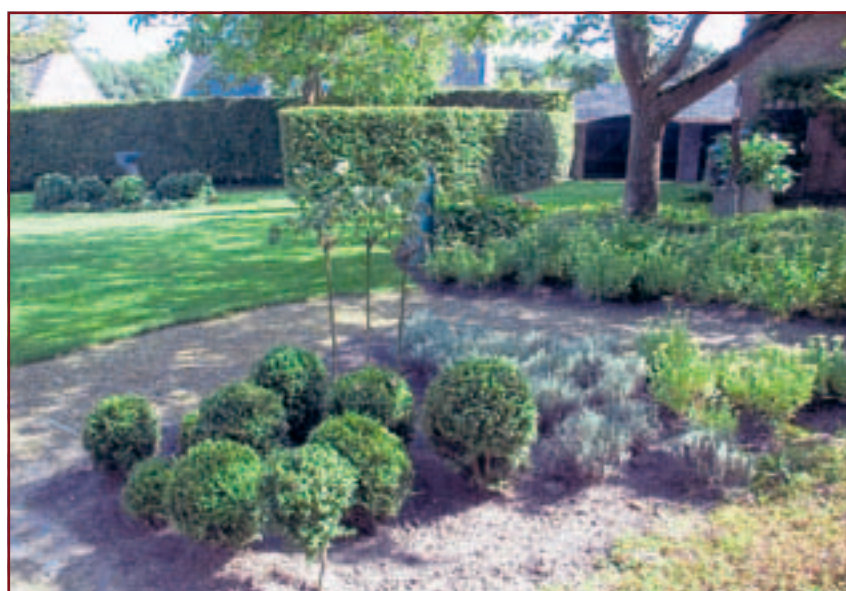
• Overal in de tuin zijn rustplekje gecreëerd.